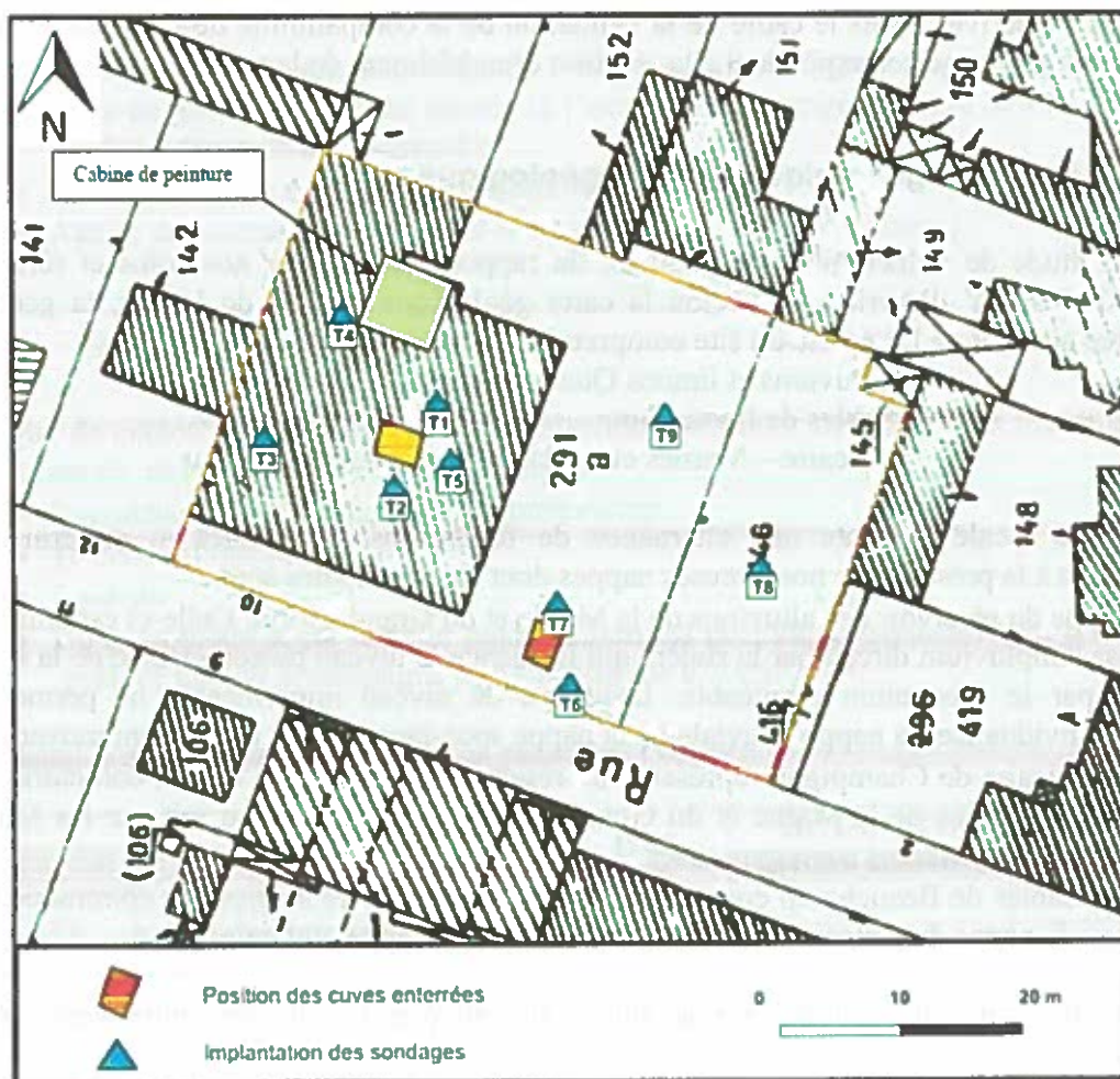
• Figure 2 : Emprise du site et emplacement des sondages (Avril 2014)

Le site d'étude se trouve au 10 rue Jules Lopard et occupe les parcelles n°146 et 291 de la section 4 du cadastre d'Esblly (77). Le site d'une superficie d'environ 2157 m 2 comprend actuellement un garage automobile et un terrain vague.